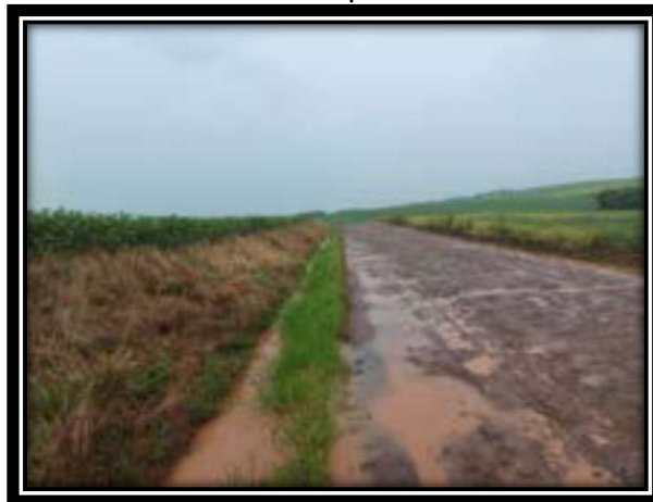
Foto 86 - Estrada municipal de acesso ao imóvel.