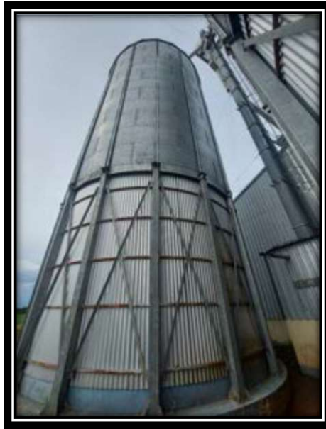
Foto 85 - Silo metálico.