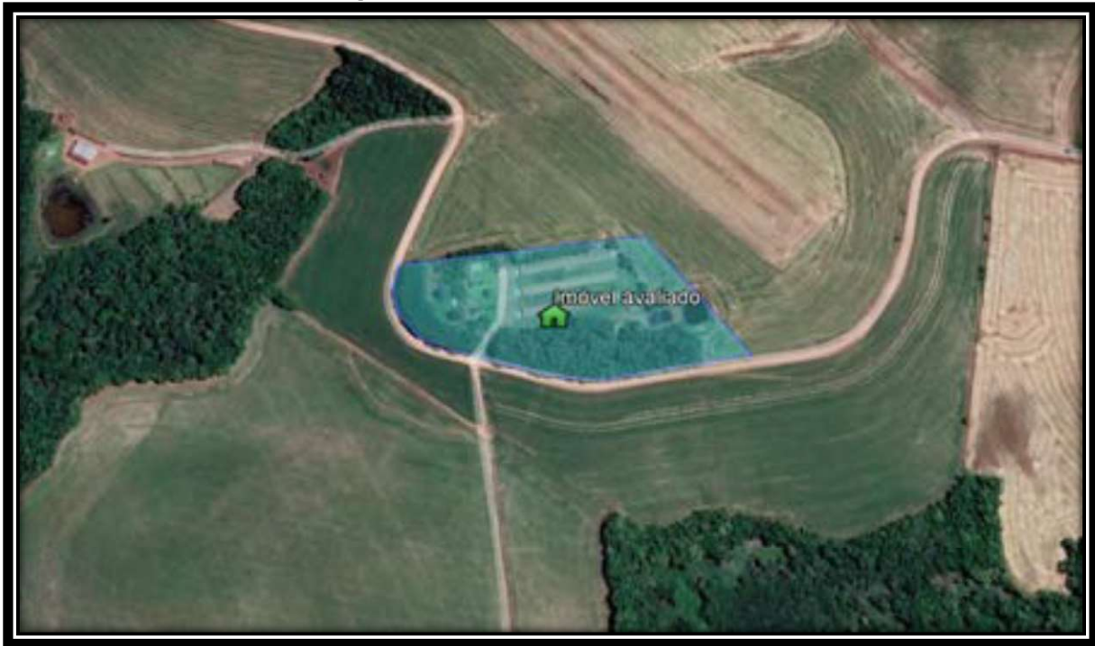
Figura 05 - Foto aérea do imóvel.

e E 316.665,1770m; 342°53'50" e 23,901m até o vértice 08, de coordenadas N 6.903.052,1940m e E 316.658,1480m; 5°06'25" e 39,140m até o vértice 09, de coordenadas N 6.903.091,1790m e E 316.661,6320m; Linha Seca; deste, segue confrontando com terras de propriedade de Arnildo Wagner e sua esposa, com os seguintes azimutes e distâncias: 77°28'41" e 214,590m até o vértice 01, ponto inicial da descrição deste perímetro, conforme matrícula n.º 20.916.