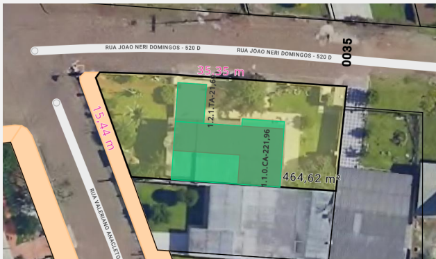
IMAGEM DO IMÓVEL